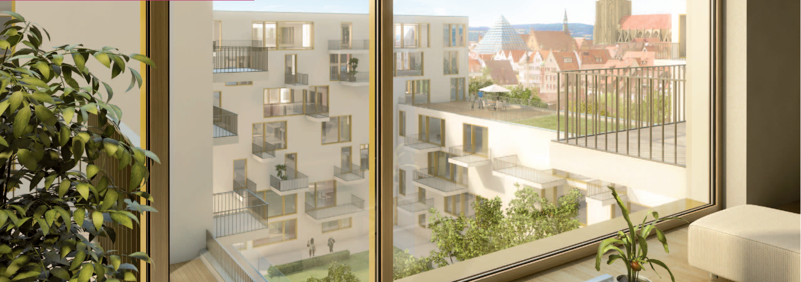
Ausblick auf Altstadt und Ulmer Münster.

Schönes und angenehmes Wohnambiente, mit zentrumsnaher Lage in komfortablen und energieeffizienten Wohnungen.