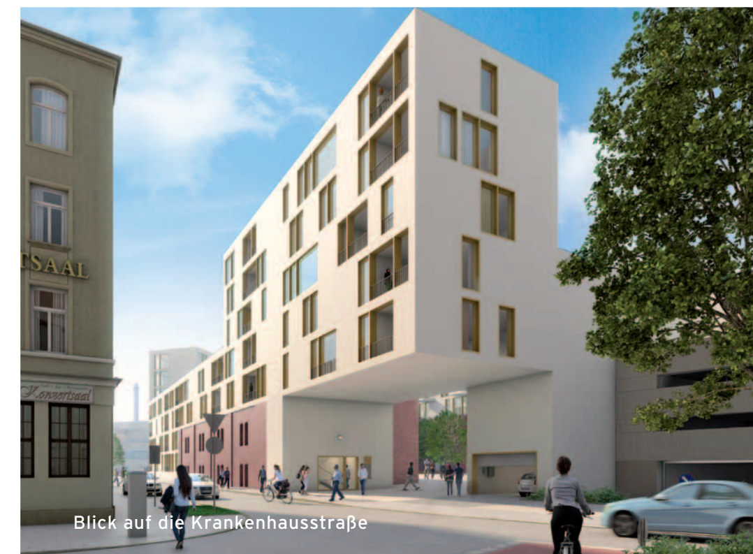
Blick auf die Krankenhausstraße