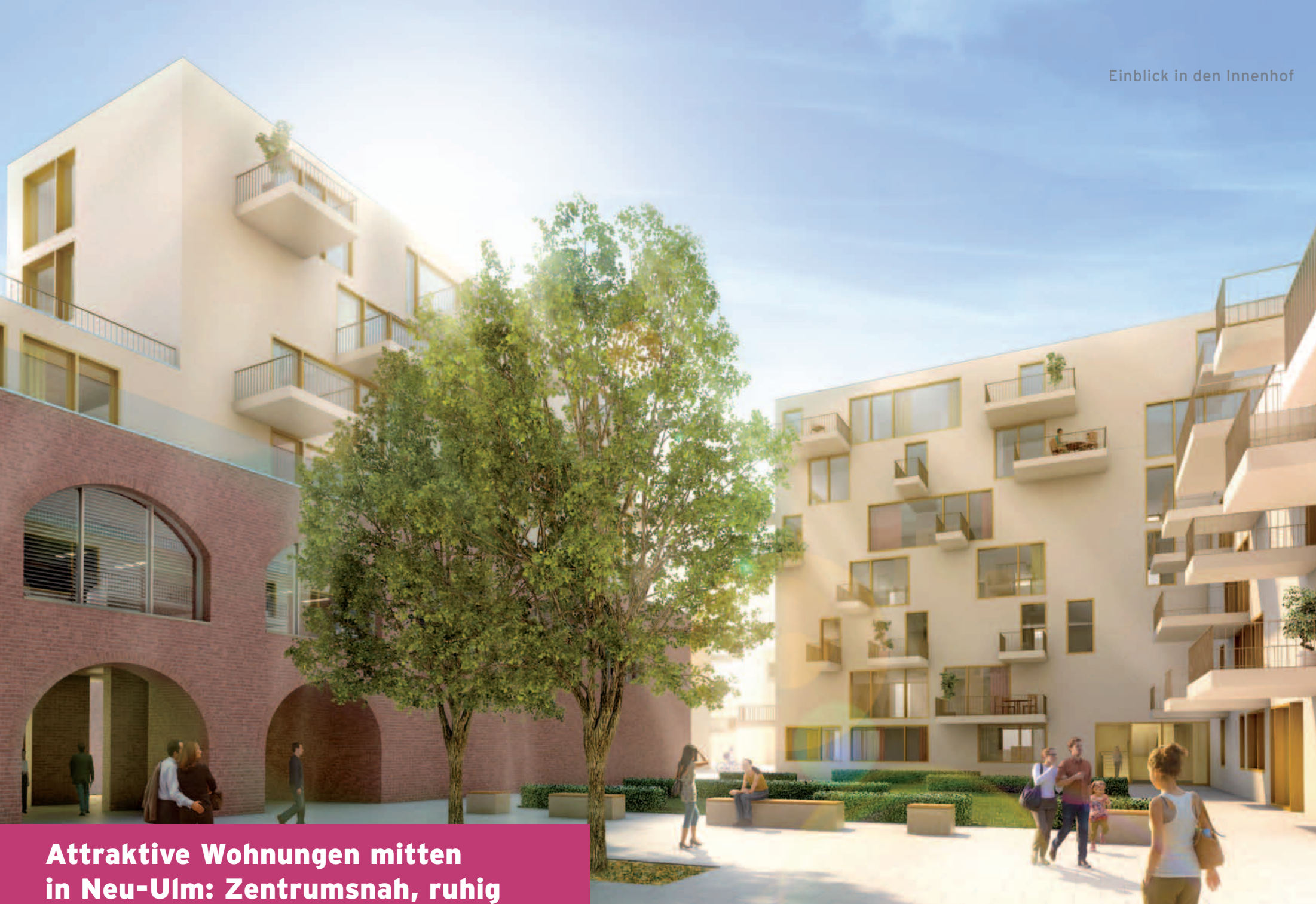
Einblick in den Innenhof

Attraktive Wohnungen mitten in Neu-Ulm: Zentrumsnah, ruhig und komfortabel. Die Verbindung von Tradition und Moderne.