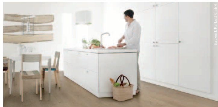
Bauwerk Parkett GmbH